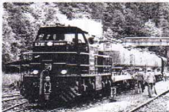
Die LTE-Lokomotive 2150.902 beim Vershub auf der Wagenübergabestelle im Terminal Waldmühle

Als weitere Hindernisse stellten sich die Abwicklung der zollrechtlichen Behandlung der Transporte, da es sich dabei ja um Importsendungen aus einem nicht EU angehörigen Drittland handelt, die Organisation der erforderlichen wagentechnischen Untersuchungen der Züge