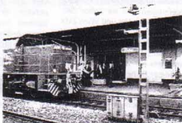
Die LTE-Lokomotive 2150.902 beim Vershub in Liesing

sche Zugsausgangsuntersuchung vorgenommen wird. Nach einem weiteren Aufenthalt im Bf. Wien Süd-Frachtbahnhof (Abfahrt: 23.20 Uhr) wird der Zug über Stadlau - Gänserndorf nach Marchegg