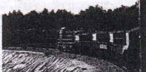
Auch bei der Eröffnungsfahrt der Anschlussbahn der Fa. Schönfelder Kies kam eine LTE-Lok zum Einsatz.

Als größtes zu lösendes Problem sollte sich allerdings der Abschluss eines Kooperationsvertrages mit den Slowakischen Staatsbahnen (ZSR), mit dem eine direkte Übergabe des Ganzzuges im