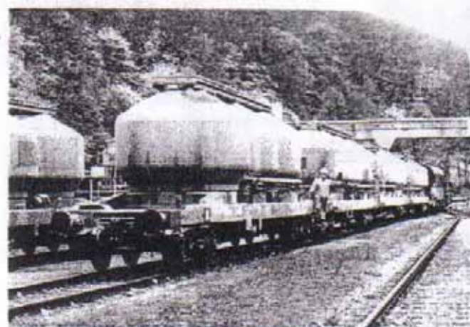
Beim Vershub von Privatwagen der Fa Holcim (Wien) in Waldmühle

Seit diesem Tag übernimmt die LTE täglich von Dienstag bis Samstag (wenn Werktag) im Bahnhof Marchegg einen Ganzzug beladen mit Zement von der ZSR und führt diesen von Marchegg (Abfahrt: 01.30 Uhr) nach Liesing (Ankunft: 03.50 Uhr). Die Züge sind im