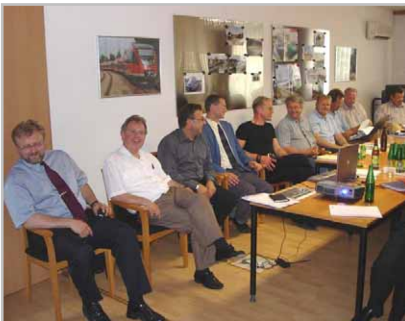
QM – Informationsveranstaltung am 30.5.2005 in der GKB-Direktion in Graz

Auf Grund des § 19 des Eisenbahngesetzes werden Eisenbahnen verpflichtet, ein Sicherheitsmanagementsystem einzuführen. Da ein Sicherheitsmanagementsystem die selben Bausteine wie ein Qualitätsmanagementsystem beinhaltet und der Schritt zu einem solchen nicht mehr allzu groß ist und sich die Einführung eines solchen im Bereich der Eisenbahnwerkstätte in mancherlei Hinsicht gelohnt hat, wurde von der Geschäftsführung der Graz-Köflacher Bahn und Busbetrieb GmbH die lückenlose Einführung eines Qualitätsmanagements, welche alle Abteilungen der GKB umfasst, beschlossen. (Weiter auf Seite 2)