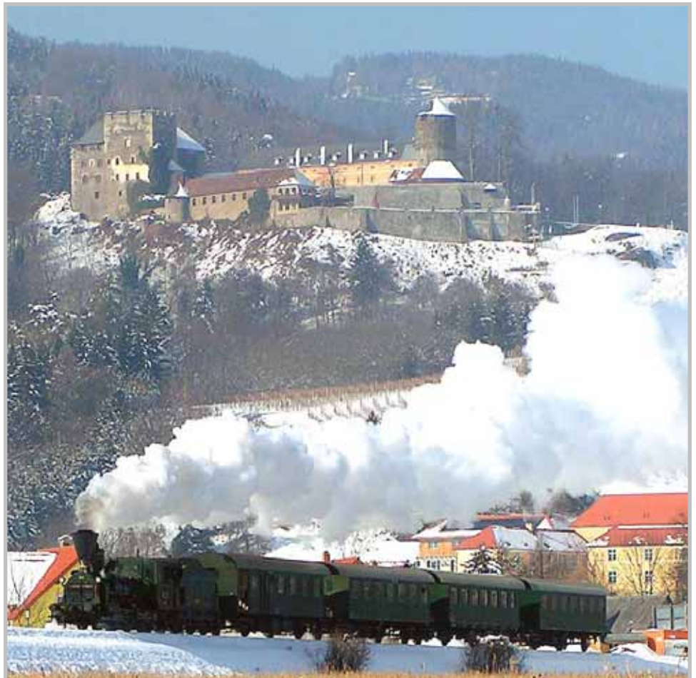
Die „671“ am 8. 2. 2005 kurz nach Deutschlandsberg.